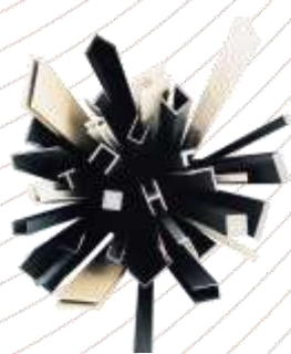
Szabványos profilok és profilszövek PVC-U, PE-HD, PP