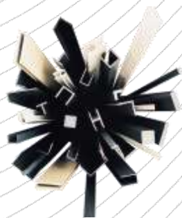
Szabványos profilok és profilszövek PVC-U, PE-HD, PP