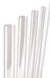
Csővek és rudak PMMA