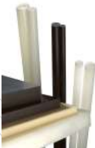
Lemezek és rudak POM-C, POM-ESD, POM-AS