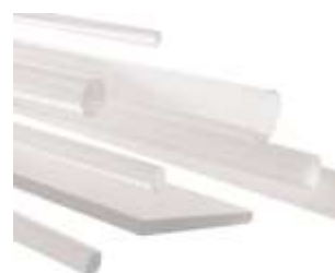
Lemezek és rudak PC (ipari minőség)