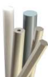
Lemezek és rudak PP-H, PP-C