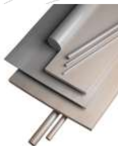
Lemezek és rudak PEEK, ECTFE, PCTFE, PTFE, FEP, PFA