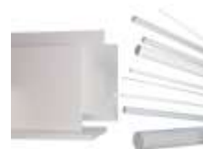
Lemezek és rudak PET (PETP)