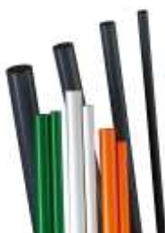
Lemezek és rudak PVC-U, PVC-C