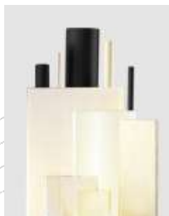
Lemezek és rudak PA 6, PA 6.6, PA 6.6 GF30