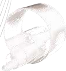
Csővek és rudak átlátszó PVC-U