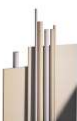
Lemezek és rudak ABS