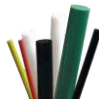
Lemezek és rudak PE-HD (PE80, PE100), PE-UHWM